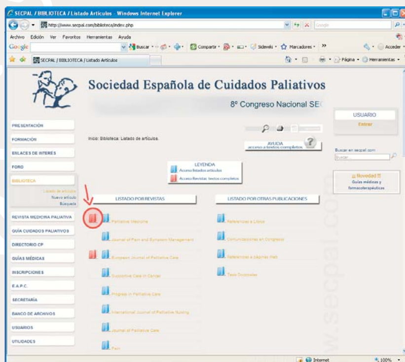
Figura 1. Biblioteca telemática y acceso a los textos completos de las revistas.

Aunque la forma más habitual es la navegación desde la página principal de la biblioteca telemática http://www.secpal.com/biblioteca/index.php prestando especial atención en el pequeño icono en forma de libro que se encuentra a la izquierda del nombre de cada revista. En dicho icono está el enlace de acceso y sólo los de color rojo disponen de textos completos. (figura 1).